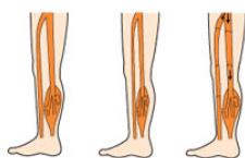
Circolazione con muscolo gonfio Circolazione con muscolo contratto Circolazione con muscolo rilassato

Indossare i gambali e accendere la macchina: inizierà il massaggio dei Vostri piedi, caviglie, polpacci e cosce grazie la gonfiaggio progressivo del gambale stesso